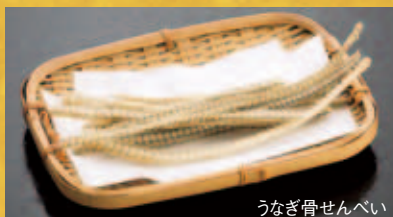
うなぎ骨せんべい