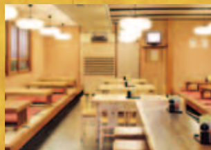
1階(全席禁煙となります)