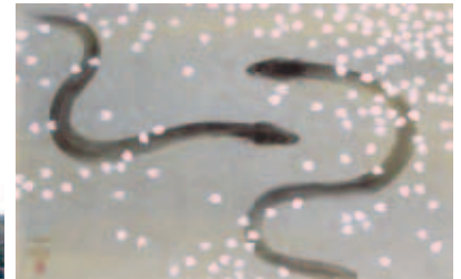
当店所蔵「散櫻花」中島千波